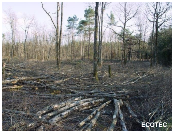
Coupe sévère, en cours de réalisation, au Bois des Bouchets, 2011.