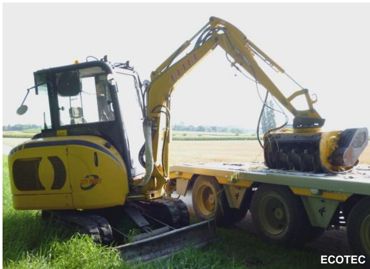
Broyeur de souches d'arbres

Elimination/arasement des souches à l'aide d'un broyeur forestier afin de faciliter l'entretien futur.