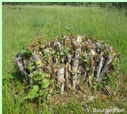
Coupe haute d'une souche, rendant difficile l'entretien de la prairie.