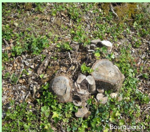
Arasement d'une souche, facile à faucher.