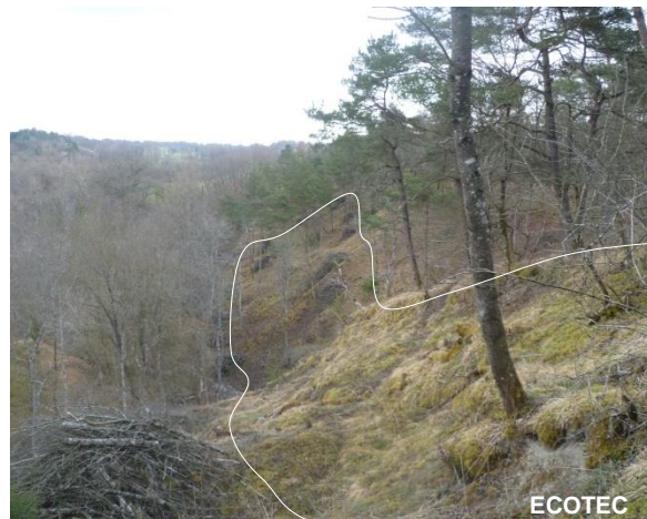
Coupe pour la création d'un couloir de connexion (tracé blanc) au Bois des Bouchets, 2011.

La mise en place d'ourlets herbacés n'est pas systématique. Elle dépend de la surface du couloir.